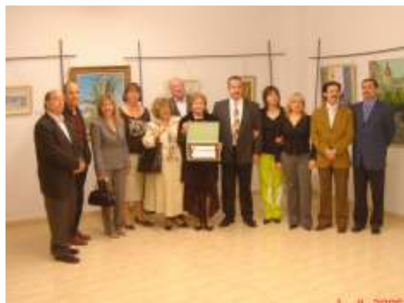
La presidenta de la Asociación Amigos de Jumilla mostrando la placa conmemorativa del hermanamiento con nuestra Asociación.