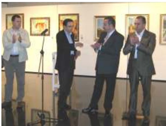
El Alcalde y el Presidente de A.B.A.E. Inaugurando la exposición "19 x 3" en el Centro de Congresos y Exposiciones de Elche.