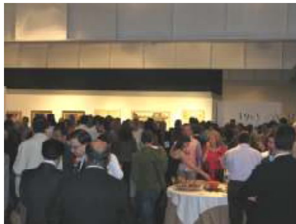
Multitudinaria presencia de público ante la tan esperada exposición en nuestra ciudad.