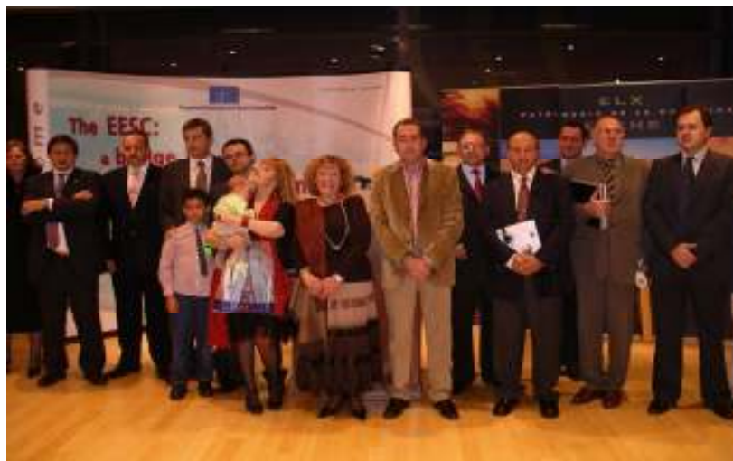
SALA DE EXPOSICIONES DEL COMITÉ ECONÓMICO Y SOCIAL DE LA UNIÓN EUROPEA EN BRUSELAS FOTO DEL GRUPO DE AUTORIDADES Y AUTORES ILCITANOS QUE VIAJÓ A BRUSELAS, DURANTE LA INAUGURACIÓN

La experiencia está resultando muy satisfactoria en todos los aspectos, por lo que desde la Asociación de Bellas Artes se continúa efectuando negociaciones para el desarrollo de nuevos proyectos de carácter internacional como el que ahora nos ocupa.