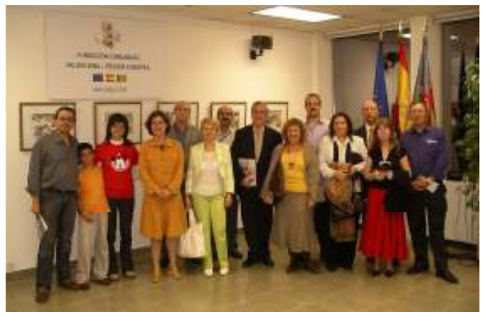
SALA DE EXPOSICIONES DE LA DELEGACIÓN DE LA COMUNIDAD VALENCIANA EN BRUSELAS. FOTO DEL GRUPO DE ILICITANOS CON AUTORIDADES EUROPEAS.