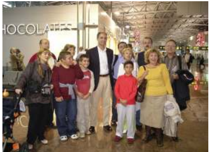
AEROPUERTO DE BRUSELAS. FOTO DEL GRUPO DE ILICITANOS QUE VIAJÓ A BRUSELAS, JUNTO CON EL PRESIDENTE DE LA GENERALITAT VALENCIANA .