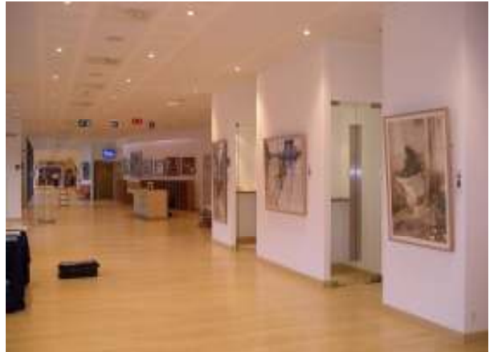
DETALLE DE LA SALA DE EXPOSICIONES DEL COMITÉ ECONÓMICO Y SOCIAL EUROPEO, DURANTE EL MONTAJE DE LAS OBRAS.