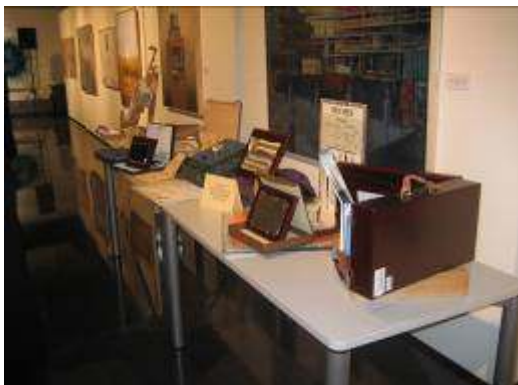
Diplomas y demás premios momentos antes de la entrega.