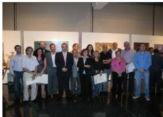
Los Premiados con las Autoridades y presidente de A.B.A.E.