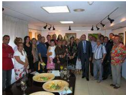
El Alcalde de Elche, Presidente de A.B.A.E., Concejala de Cultura, Presidente de la Real Orden de la Dama de Elche, Autoridades y Pintores en la inauguración.

-El pasado mes de agosto nuestra Asociación organizó en colaboración con el Patronato de la Real Orden de la Dama, la exposición de pintura y escultura, que con motivo de la celebración de los 110 años del descubrimiento de nuestra Dama de Elche patrocinaron dicho Patronato y el Ayuntamiento ilicitano.