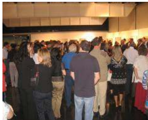
Numerosísimo público asistente a la inauguración del Certamen.